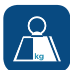
Peso totale ▼