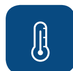
Massima temperatura di lavaggio ▼