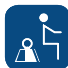
Peso massimo paziente ▼