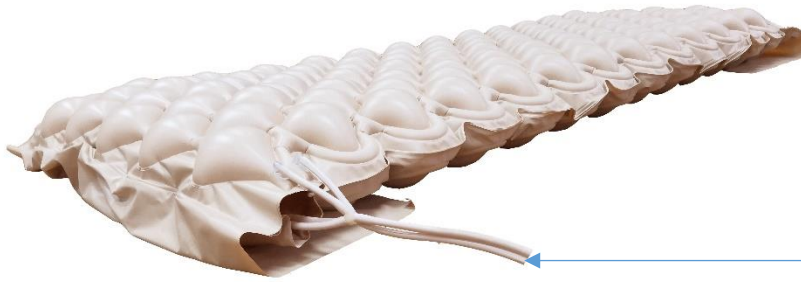
Tubi di raccordo compressore