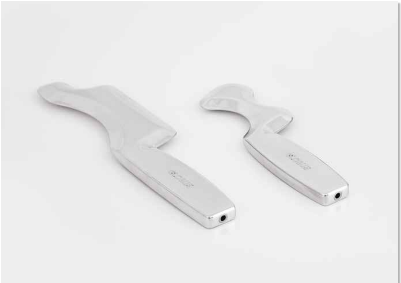
Cod. G6041 KIT FASCIA TOOLS BEAUTY