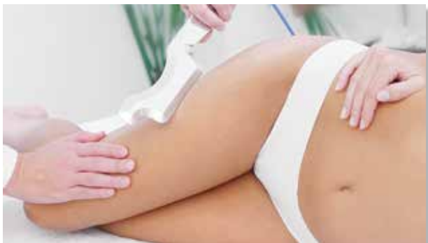
DiaBlade Large: manipolo per il trattamento dell'Arto Inferiore, in particolare di Cosce e Glutei..