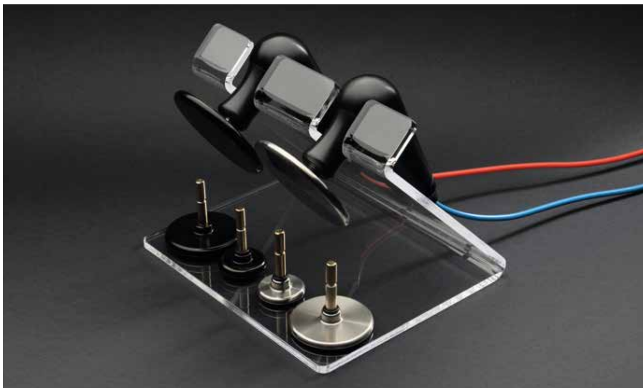
G6341 | SUPPORTO ACCESSORI PER DISPOSITIVI "DIACARE 5000" E "5000 RE" - "TECAR BEAUTY 6000 MED" E 6000 MED RE"