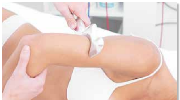
DiaBlade Small: manipolo per il trattamento dell'Arto Superiore e della regione del Collo.