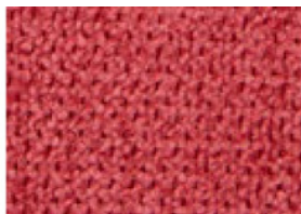
1 TESSUTO ROSSO