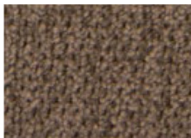
3 TESSUTO TORTORA