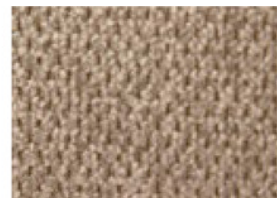
4 TESSUTO BEIGE