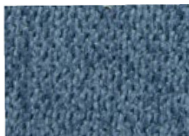
2 TESSUTO BLU