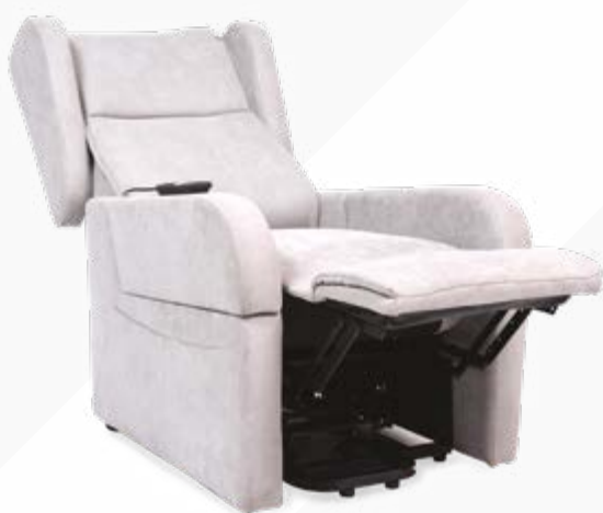
■ POSIZIONE RELAX