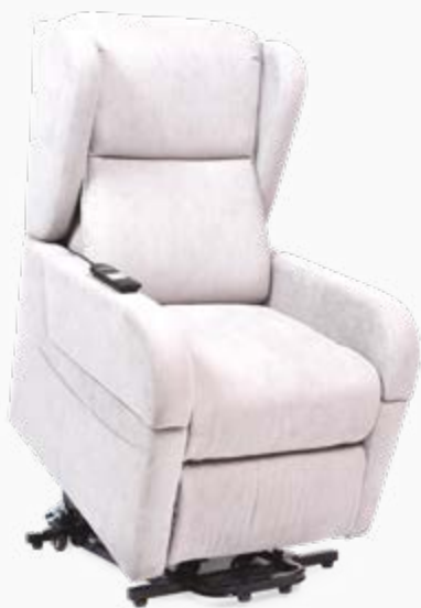
■ POSIZIONE LIFT-UP