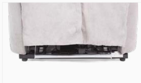
■ ROLLER SYSTEM - STANDARD