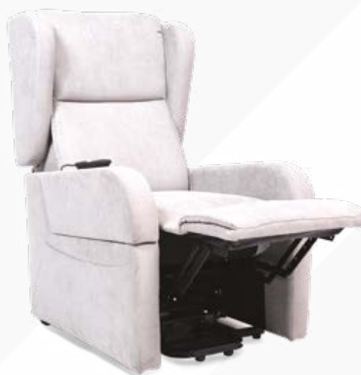
■ POSIZIONE TV