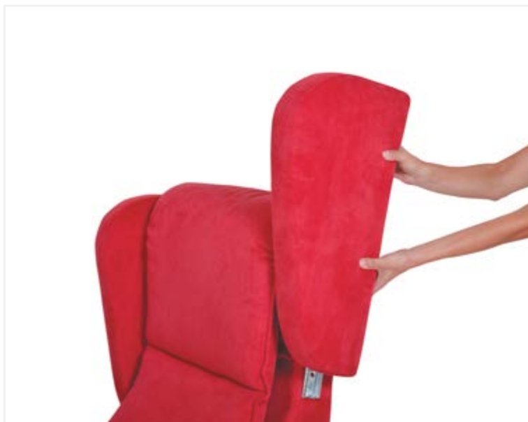
■ POGGIATESTA LATERALI ESTRAIBILI

Lo smontaggio delle parti laterali permette la traslazione dell'utente dalla poltrona al letto, o alla sedia a rotelle ecc. I braccioli estraibili permettono anche di posizionare la poltrona sotto al tavolo da pranzo.