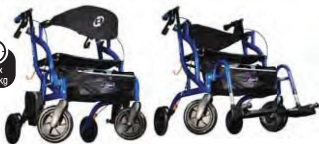
Cinghia di chiusura