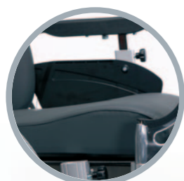
Braccioli estraibili, regolabili in altezza e larghezza. Sedile regolabile in profondità