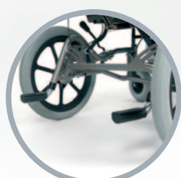
Due pedane posizionate nella parte posteriore favoriscono il superamento degli ostacoli