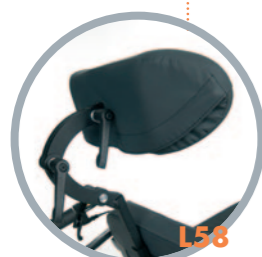
Appoggiatesta regolabile in rotazione e traslazione laterale