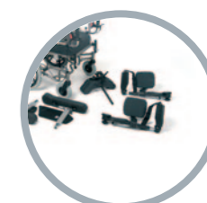
Facile da trasportare