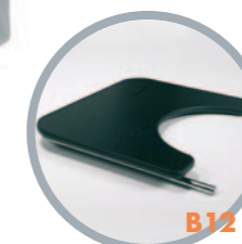
Tavolino in legno ribaltabile