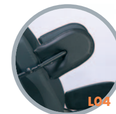
Spinte laterali (su richiesta)