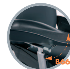
Bracciolo per emiplegico (su richiesta)