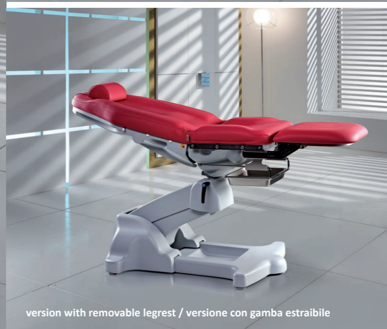
version with removable legrest / versione con gamba estraibile