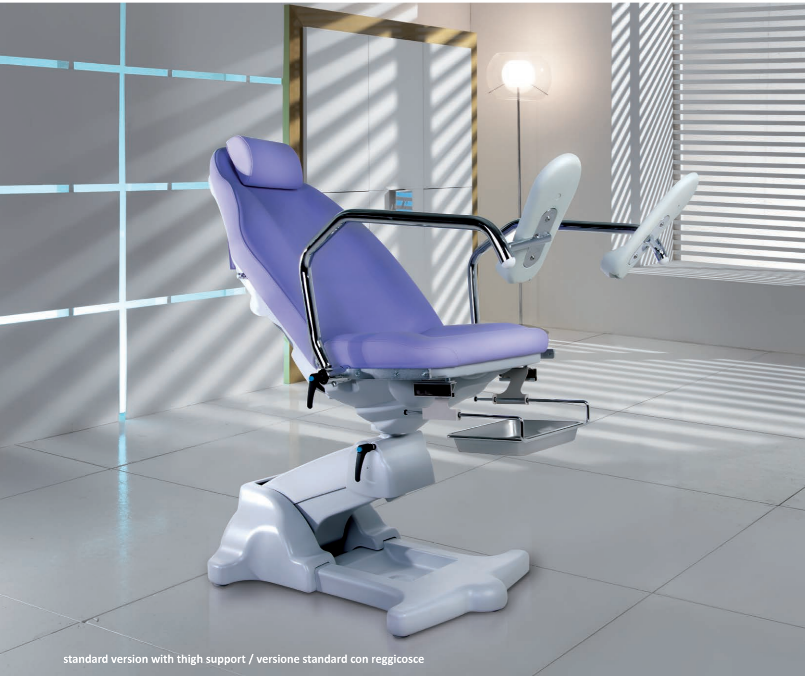
standard version with thigh support / versione standard con reggicose