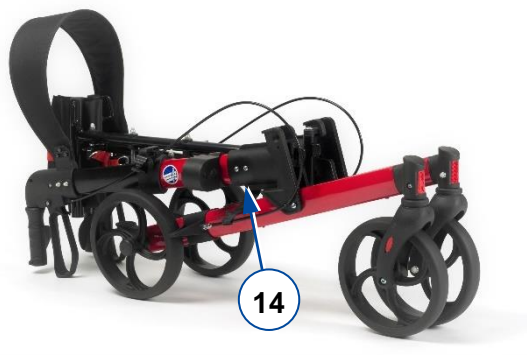
Figura 2: Chiusura del rollator