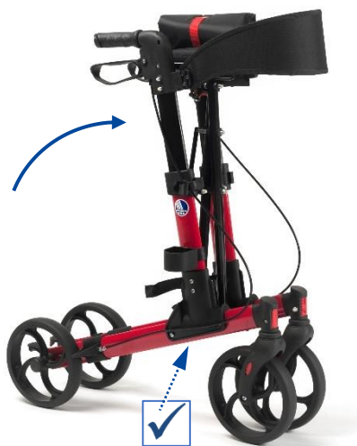
Figura 1: Apertura del rollator