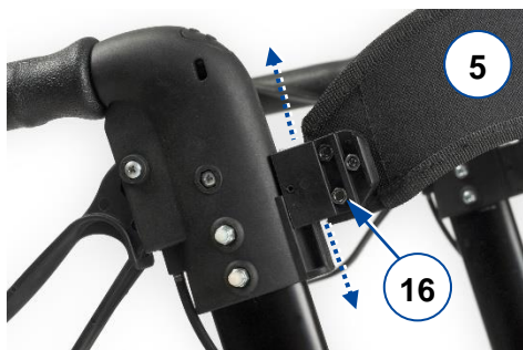
Figura 3: Montaggio/smontaggio a scorrimento della fascia dello schienale