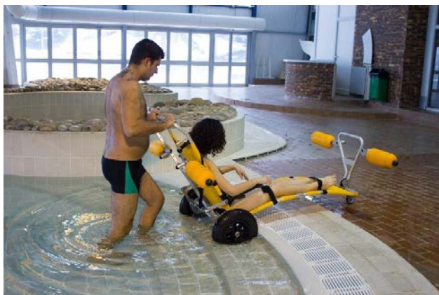
Scendere le scale