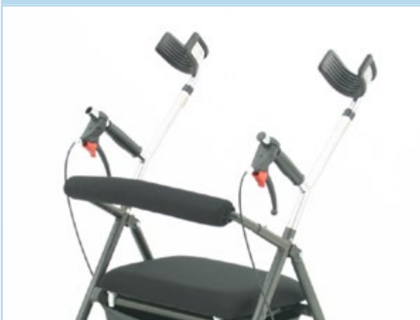
Sostegni a stampella