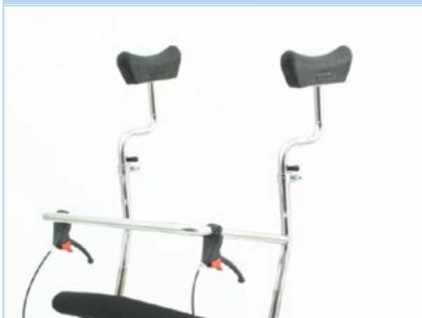
Sostegni ascellari e manubrio