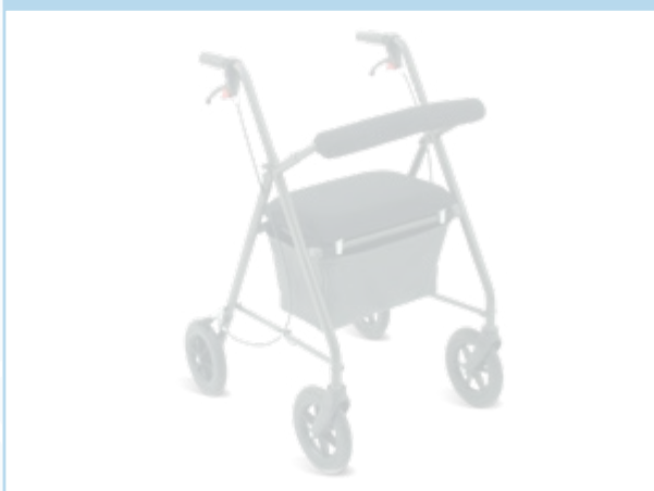
Ruote con blocco direzionale